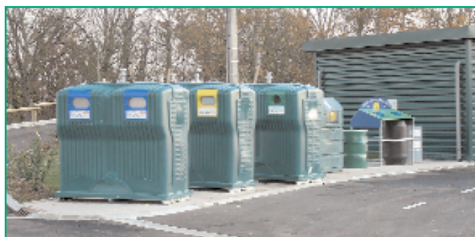
Déchetterie de Chouzy-sur-Cisse

Attention ! Certains déchets ne peuvent pas être recyclés : pots de produits laitiers (yaourt, fromage blanc, crème fraîche), films et sacs plastiques, barquettes en plastique et en polystyrène, papier gras, vaisselle en carton, mouchoirs en papier, essuie-tout, couches-culottes, enveloppes, films plastiques enveloppant les revues, papier - cadeau, papier déchiré en petits morceaux. Ils doivent être déposés dans la poubelle ménagère. Vaisselle, porcelaine, vitre, miroir, faïence, pot de fleurs, ampoule électrique et les récipients ayant contenu des produits toxiques (détergents, acides, ...) doivent être déposés en déchetterie.